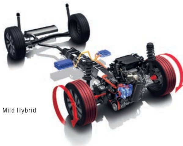
■ Mild Hybrid

Kompaktný a ľahký Hybrid systém sa skladá zo štvorvalcového motora 1,5 l DUALJET (K15C), jednotky motor-generátora (MGU), systému prevodovky AGS (automatická prevodovka) a napájacieho agregátu (140 V lítium-iónový akumulátor a menič). Jednotka MGU využíva výkon motora na efektívne generovanie elektrickej energie, ktorá zvyšuje dojazd a frekvenciu jazdy na elektrinu pre nižšiu spotrebu paliva a tichú jazdu.